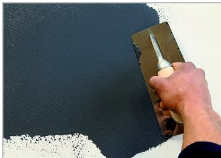
Paso 3 - De primera mano, distribuir libremente el producto con la llana.