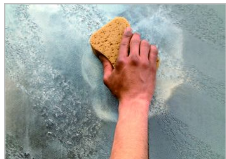
Paso 6 - Obtener el acabado deseado con Gioia, Oro, pintura blanca o de Cera del Vecchio. Si es necesario, aumentar la protección de la superficie con Vetro-Frammenti.