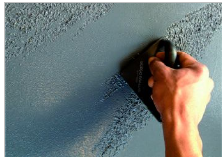
Paso 4 - Hacer realidad el efecto deseado con los accesorios específicos.