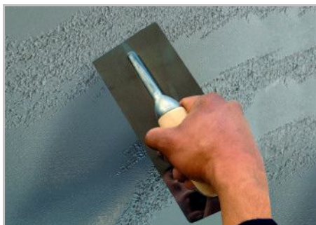
Paso 5 - Tan pronto como comienza el producto a marchitarse proceder a la compactación.