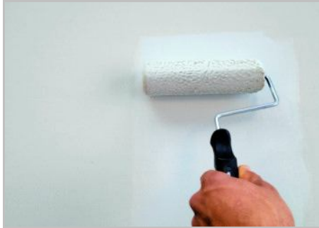
Paso 1 - Para empezar, se aplica Espátula Stuhli Primer Naturale.

Conservación: en un lugar seco, fresco, lejos de la humedad y las heladas.